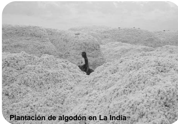
Plantación de algodón en La India

Es Greenpeace la que propone a partir de 2001 una colección textil respondiendo a los estándares ecológicos más exigentes y así nace este producto con alternativas a las técnicas contaminantes del cultivo intensivo del algodón, lo hace a través de Maikaal. Es la cooperativa Maikaal la que se perfila como una manera de hacer frente a la amenaza que supone para el medioambiente el anuncio de la introducción posible del algodón transgénico.