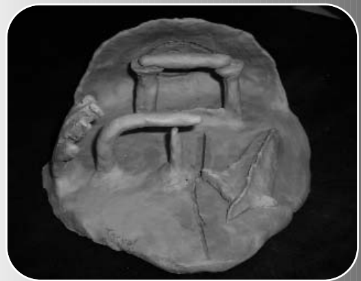
"Es la cárcel"

Es difícil, si no imposible, expresaren una sola obra la multitud de pensamientos, sentimientos y emociones que se mezclan en mi cabeza estando en la cárcel. Quizá cuando salga separe los colores y pinte una nueva vida. (Mendo)